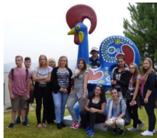
Tanulóink Portugáliában (2018)

Iskolánk felvállalja a sajátos nevelési igényű (SNI) tanulók esetében a beszédfigyafatékos és a pszichés fejlődési zavarral (súlyos tanulási, figyelem- vagy magatartásszabályozási zavarral) küzdő tanulók oktatását, illetve a beilleszkedési, tanulási, magatartási nehézséggel (BTMN) küzdő tanulók ellátását. Kérjük a jelentkezési laphoz csatolni a szakértői bizottság vagy a nevelési tanácsadó szakvéleményét is.