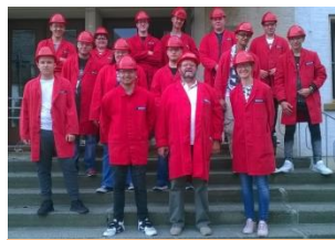
Németországi szakmai gyakorlaton

Aki most az Illéssy-iskolát választja a középiskolai tanulmányok színteréül, okos döntést hoz gyermeké jövőjével kapcsolatban.